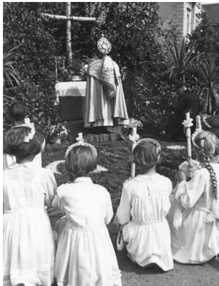
Fronleichnam Pfullingen 1952 (Prozession) und 1954 (Sakramentaler Segen)