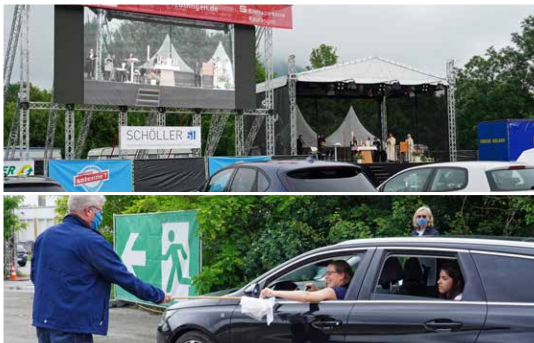
Fronleichnam während der Corona-Pandemie als Autokino am 11.06.2020 auf dem Arbach-Areal Pfullingen (Prozession im Autokorso, Übertragung auf's Autoradio im Fahrzeuginnern, Kollekte bei der Ausfahrt)

Nach dem Fronleichnamsfest 2025 mit Prozession und einer Station unterwegs in Hl. Bruder Konrad Lichtenstein-Unterhausen feiern wir dieses Jahr das Hochfest des Leibes und Blutes Christi in Pfullingen: Donnerstag, 4. Juni 2026, 10 Uhr, beginnend im Alten Stadtgarten Pfullingen (zwischen Uhlandschule und Friedhof).