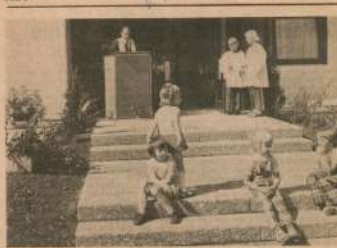
Verab Soziale ergreifen haben bewies diese Umfassung Kinder von ihnen neuen Kinder geteilt während der neunmonatigen Gebrauchszeit.