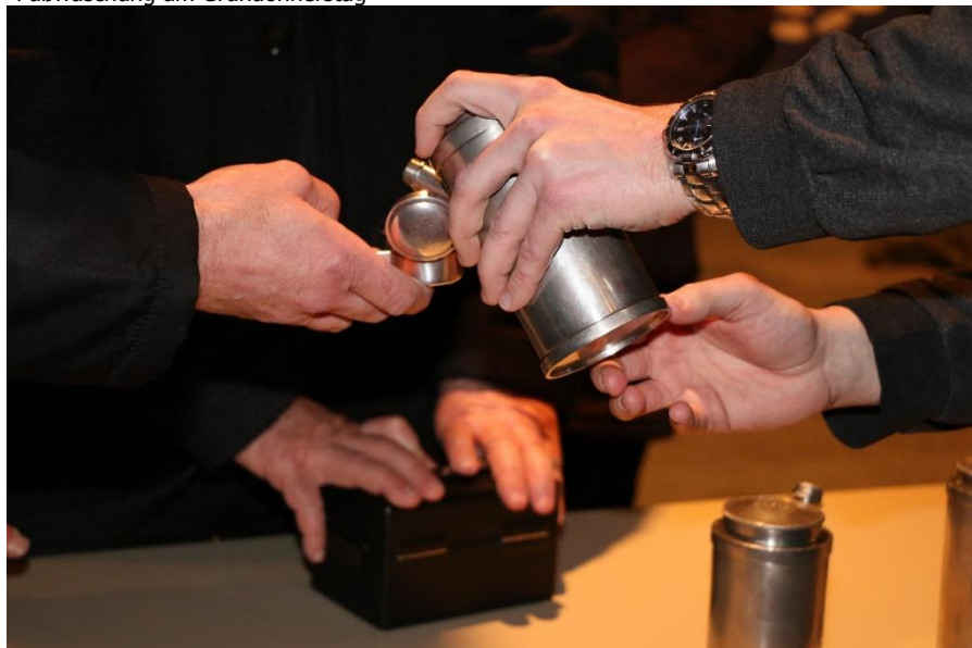
Verteilen der Heiligen Öle