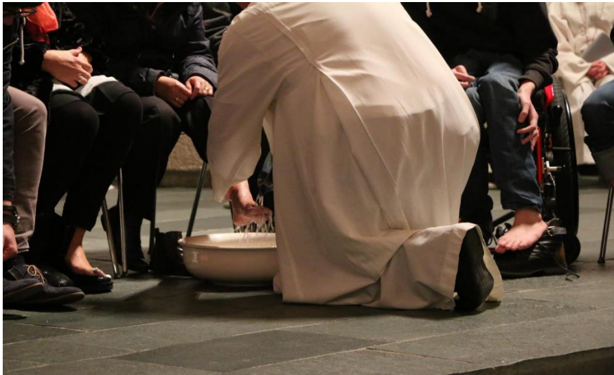
Fußwaschung am Gründonnerstag

Mit Hand und Fuß in den Spuren des Auferstandenen